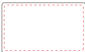
長方形35×20mm (クリップマーカー角型)